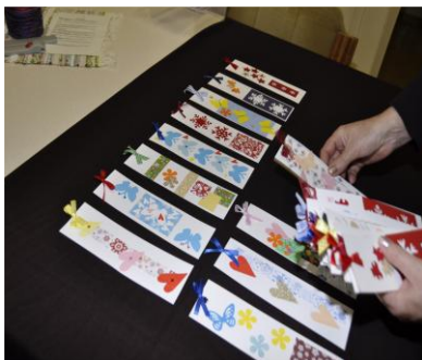
Tiskařská dílna - záložky

Pokud se někdo dostal do psychické krize nebo sociální izolace, mohu návštěvu centra Iskérka z vlastní zkušenosti doporučit.“