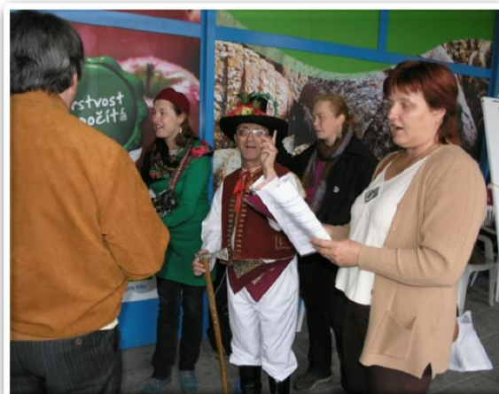
Propagační kampaň na Masarykově náměstí v Rožnově - "My jsme pořád tady"