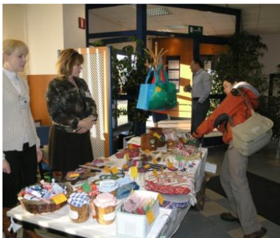
Vánoční jarmark v On Semi, prosinec 2013