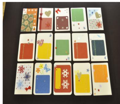
Tiskařská dílna - přáníčka