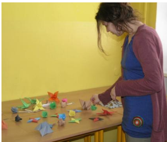
Férový den otevřených dveří ZŠ Pod Skalkou