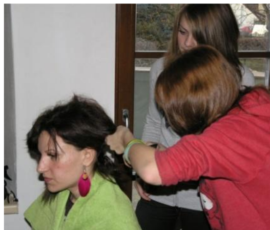
Kadeřnice v Iskérece, prosinec 2013