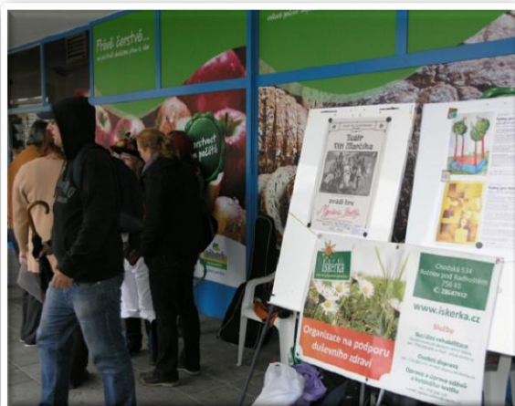
Propagační kampaň na Masarykově náměstí v Rožnově - "My jsme pořád tady"