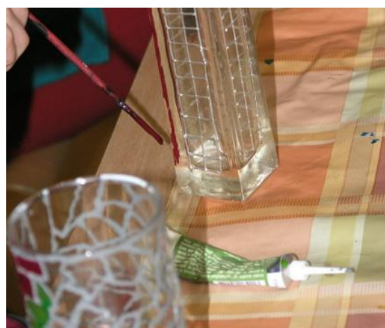
Férový den otevřených dveří ZŠ Pod Skalkou