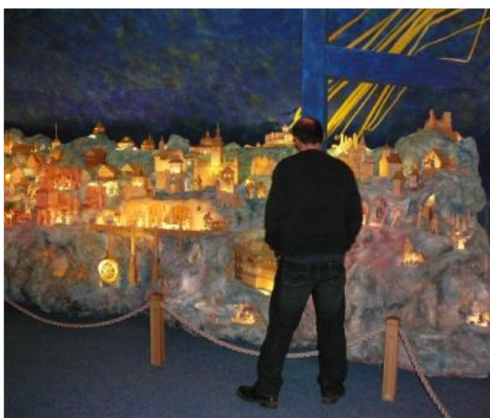
Výlet do Horní Lidče – Betlém, březen 2013