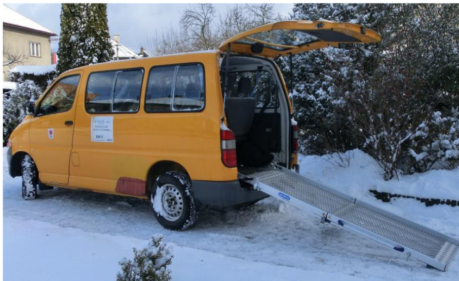
Toyota Hiace - možnost pronájmu, včetně plošiny pro osoby s fyzickým handicapem

Zájem veřejnosti byl zejména o pronájem místností a automobilu.