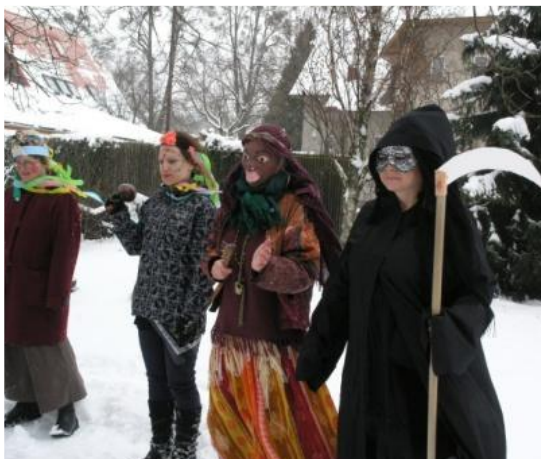
Masopust v Iskérece, únor 2013