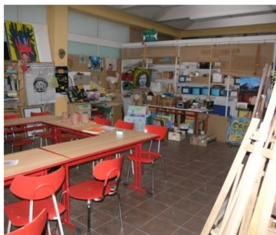
Návštěva v Baobabu, květen 2013