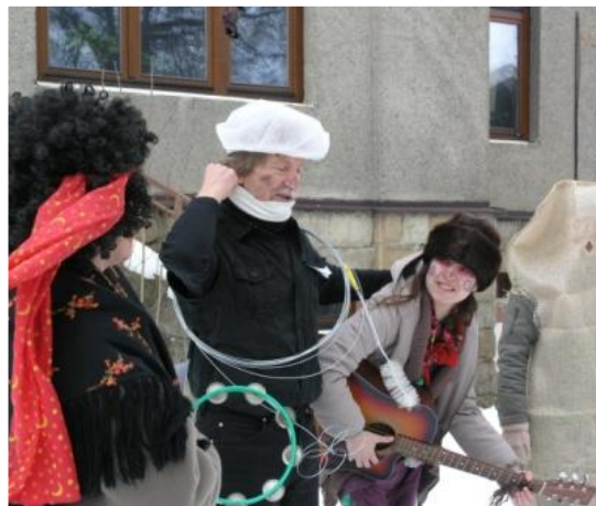
Masopust v Iskérece, únor 2013